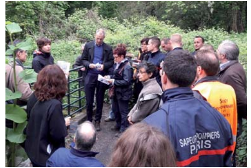
Atelier sur le site du Bec de Canard le 22 avril 2017 ▲

L'occasion de faire le bilan des actions de concertation du premier semestre et d'annoncer les suivantes : un atelier immersif portant sur le Bec de Canard a rassemblé 25 personnes le samedi 22 avril dernier. Ce site a été identifié parmi les espaces à fort enjeu écologique dans le SADD. De nombreuses propositions ont été recensées lors de cet atelier, sur la biodiversité et les continuités écologiques mais aussi sur les cheminements, la valorisation pédagogique, etc. Ports de Paris poursuit maintenant la concrétisation de ce projet à travers la mise en place d'un comité de pilotage et le choix d'un assistant à maîtrise d'ouvrage pour l'élaboration d'un pré-programme.