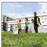
Journée citoyenne de nettoyage p.7