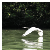
Croisière gourmande sur la Marne p.11