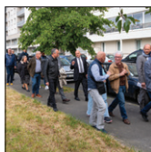
Visites de quartiers p.6